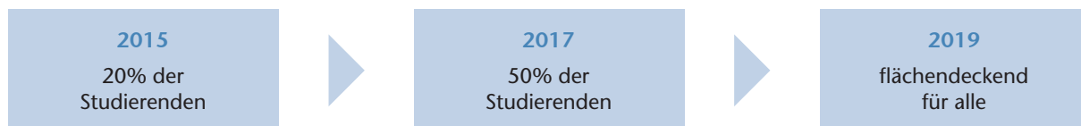
Abbildung 1: Vorschlag zur schrittweisen Einführung des Pflichtquartals Allgemeinmedizin 2

Durch die Einführung und Erweiterung des Blockpraktikums Allgemeinmedizin und des PJ-Wahltertials Allgemeinmedizin verfügen die universitären Standorte bereits über umfangreiche Erfahrungen bei der Rekrutierung und Qualifizierung von Lehrpraxen.